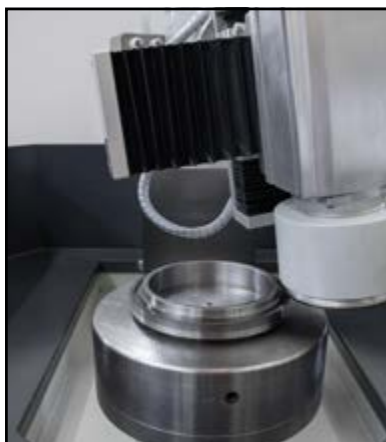
Affûtage contre-couteau single avec meule frontale (en option)

Afilado de contra-cuchilla estándar con muela frontal (opcional)