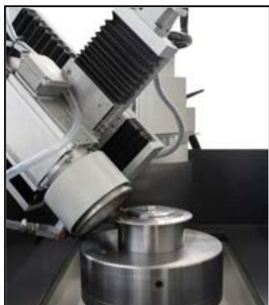
Affûtage du disque biseauté avec meule frontale (en option)

Afilado de disco biselado con muela frontal (opcional)