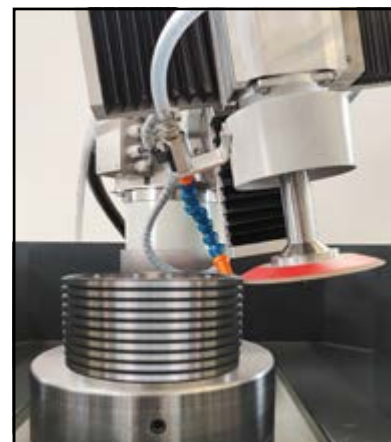
Affûtage contre-lame multiple avec rallonge et meule frontale à disque

Afilado de contra-cuchilla múltiple con extensión y muela frontal en forma de disco